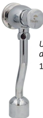
Urinario Botón sin Válvula de Corte y Conexión Curva 100010500