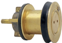
Cartridge Repuesto Fluxómetro Nuevo 100012405