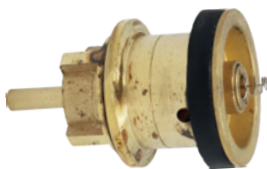
Cartridge Repuesto Fluxómetro 100012400