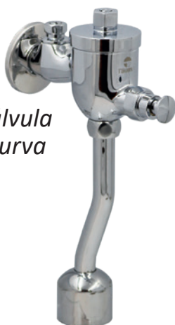
Urinario Botón con Válvula de Corte y Conexión Curva 100010400