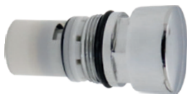
Cartridge Repuesto Llave Lavatorio Temporizada 100012300