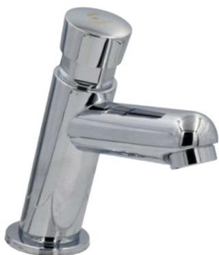
Llave Lavatorio Temporizada Punta Cuadrada Chica 100010100