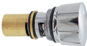
Cartridge Repuesto Llave Lavatorio Temporizada Nueva 100012305