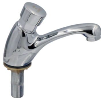
Llave Lavatorio Temporizada Gorda Mediana 100010300