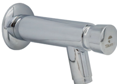
Llave al Muro Temporizada Larga 100010150